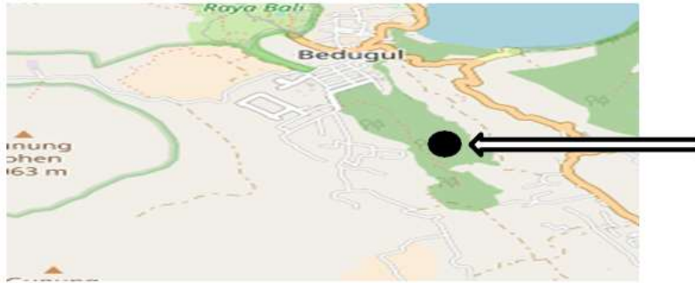
Gambar 1. Lokasi Penelitian Lahan Budidaya Kentang Organik Desa Candikuning Kabupaten Tabanan

Alat-alat yang digunakan untuk melakukan pengamatan keanekaragaman jenis makrofauna tanah seperti: sekop yang digunakan untuk menggali tanah pada lahan kentang organik, baskom yang digunakan menaruh makrofauna